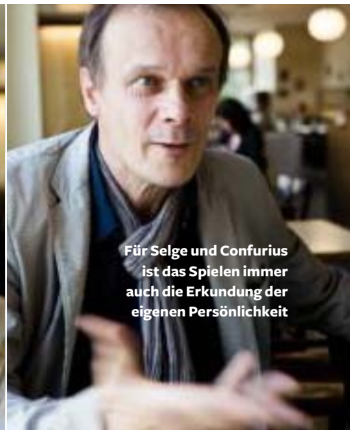
Für Selge und Confurius ist das Spielen immer auch die Erkundung der eigenen Persönlichkeit