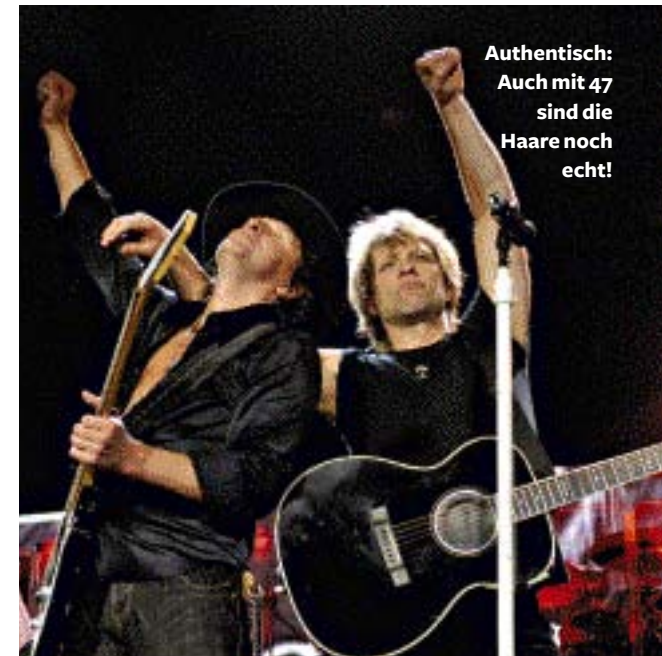
Authentisch: Auch mit 47 sind die Haare noch echt!

JBj: Ich habe nicht vor, der nächste Mick Jagger zu werden und das noch