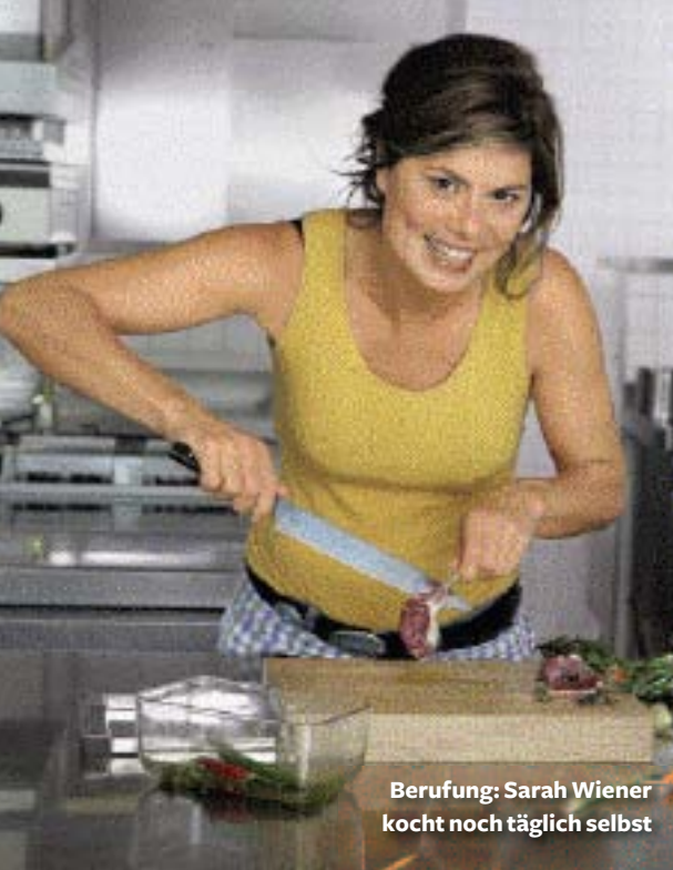
Berufung: Sarah Wiener kocht noch täglich selbst

bei der Ernährung. Und wenn man heute schon gar nicht mehr weiß, was in diesen Lebensmitteln drin ist, bin ich Pragmatiker und sage: Ich esse nichts, was ich nicht auf dem Etikett identifizieren kann.