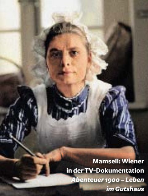
Mamsell: Wiener in der TV-Dokumentation Abenteuer 1900 – Leben im Gutshaus

RD: Und was ist das Harte daran, das Mobile oder der Filmschaffende?